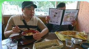
みらいの喫茶で昼食☆