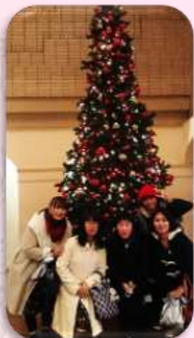
お店の前のツリーでハイ♪チーズ♪♪

博多センターザの地下にあるフラッセリーフ千サンクでランチしました♪お酒落で少しリッチな気分になりました。