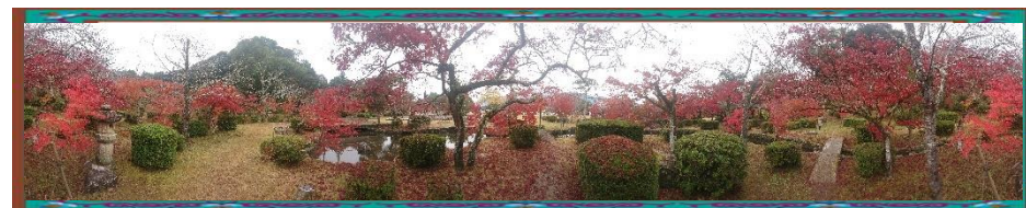
紅葉 Alias 様