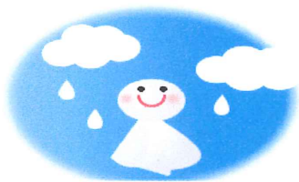
雨も吹き飛ぶ熱気でした