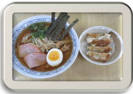
美味しそうですね♪