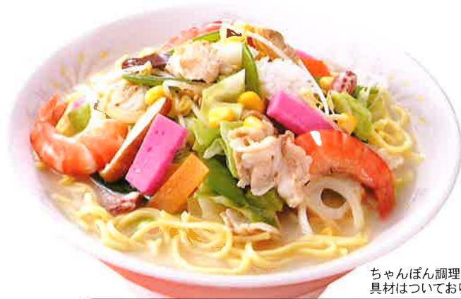
ちゃんぽん調理例 具材はついておりません