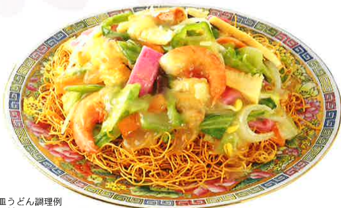
皿うどん調理例 具材はついておりません