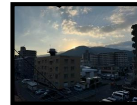
初日の出 YK 様