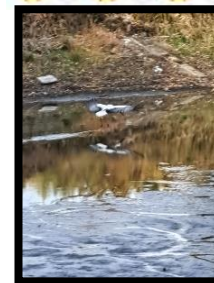
コウノトリ Mami 様