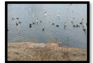
野鳥 Libra 様