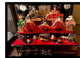
おひな様 YK 様