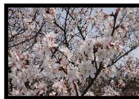
さくら Alias 様