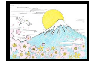
富士山 YS 様