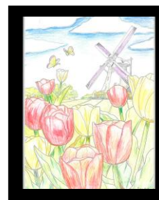
風車とチューリップ よっしゅう 様