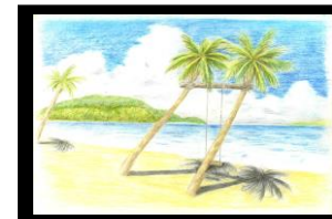
能古島 Alias 様