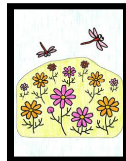
秋 YS 様