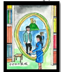
かがみの孤城 よっしゅう 様

今年も皆様からの作品 (絵・写真・書道など) を募集します。応募をお待ち しています。