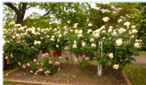
駕与丁公園のバラ とても綺麗でした ✨