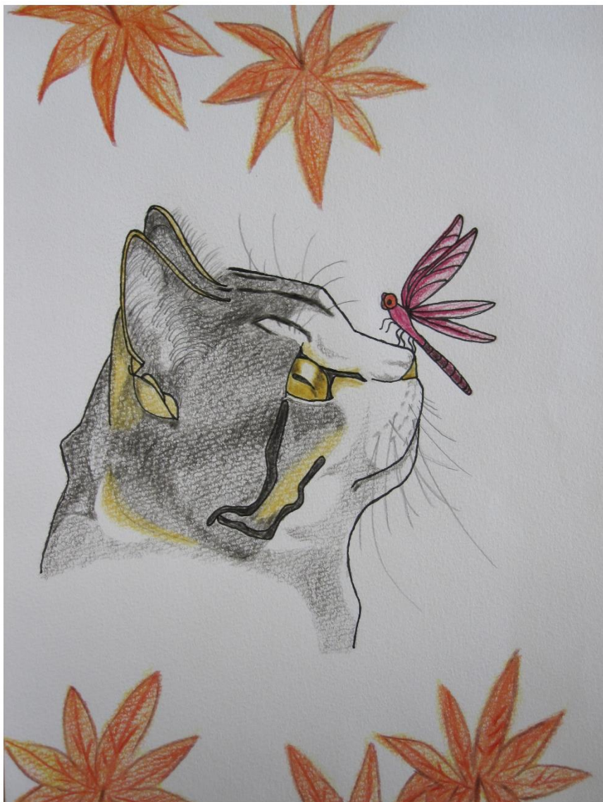
表紙 ステップアップⅢ型 Yさん